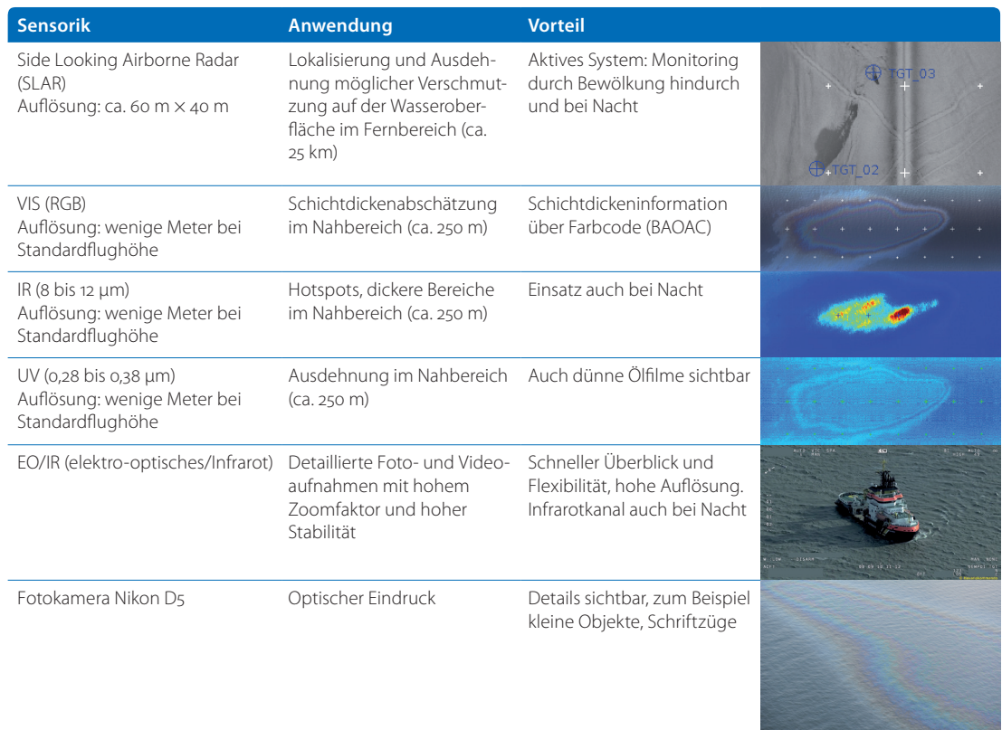
Tabelle 1: Hauptsensorik zur Detektion und Charakterisierung von Ölverschmutzungen auf dem Meer. Der Bonn Agreement Oil Appearance Code (BAOAC) ist ein standardisiertes visuelles Klassifikationssystem, das anhand von Farb- und Erscheinungsmerkmalen die Dicke von Ölfilmen auf Wasser aus der Luft abschätzt (Bonn Agreement 2022)

Die beiden Sensorflugzeuge des Typs Dornier 228 (Do228) sind mit Sensorsystemen ausgestattet, die speziell für die Detektion und Charakterisierung von Öl entwickelt wurden (siehe Tabelle 1 ;