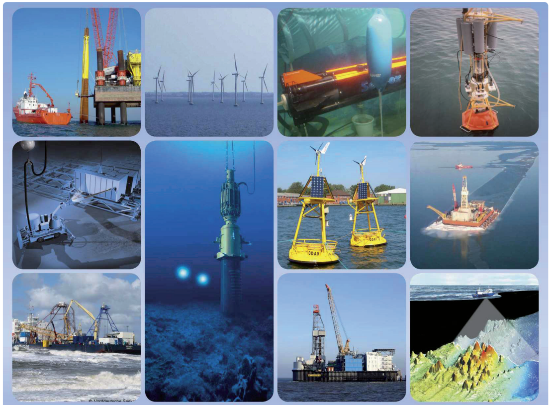
Abb. 1: Meerestechnik im Einsatz