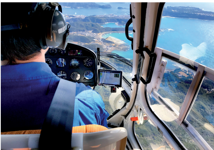
Abb. 2: Vermessung von Küstengebieten in Japan mit dem RIEGL VQ-880-GH, integriert im Vermessungshubschrauber von NAKANIHON

Die Bedeutung der hydrographischen Vermessung hat in den letzten Jahren verstärkt öffentliche Aufmerksamkeit erhalten: Die dramatische Gefährdung unserer Gewässer als Trinkwasservorrat, Nahrungsmittelquelle und Verkehrsweg, aber auch die Bedrohungen von Lebensraum und Ressourcen durch Trockenheit und Überflutungen sind aktuell viel diskutierte Themen. Es ist zu erwarten, dass sich hieraus weiteres Marktpotenzial für die zum Einsatz gebrachten Messsysteme – aber auch zusätzliche, neue Anforderungen – ergeben werden. Durch intensive Zusammenarbeit mit Kunden, Partnern und Forschungsinstituten setzt RIEGL alles daran, neue Fragestellungen früh zu erkennen und durch kontinuierliche Weiterentwicklung zuverlässige technologische Antworten zu definieren. //